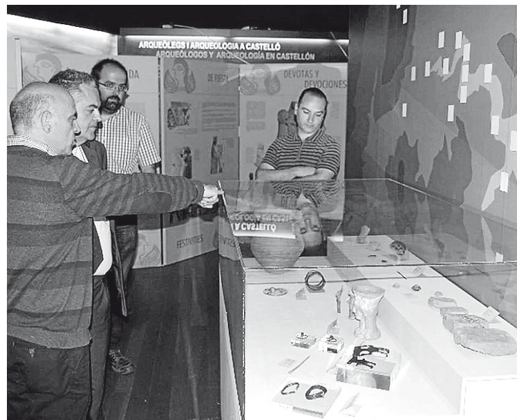
►► La muestra ofrece la posibilidad de contemplar objetos cotidianos.

Finalmente, las mujeres en las necrópolis se hacen visibles a través de importantes esculturas, como la Dama de Elche o de Baza, hitos del arte ibérico, y de sepulturas singulares que por la riqueza de su ajuar demuestran la existencia de mujeres con poder. Una mirada hacia el pasado. ■